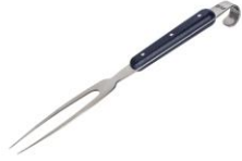
*Fourchette à viande

Pratique pour bien tenir une pièce de viande