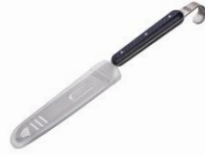
Couteau à viande

Pratique pour bien tenir une pièce de viande