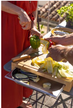
Planche à découper en bois debout Bac gastro inox GN2/3, compatible lave-vaisselle Idéal pour découper et réserver les aliments