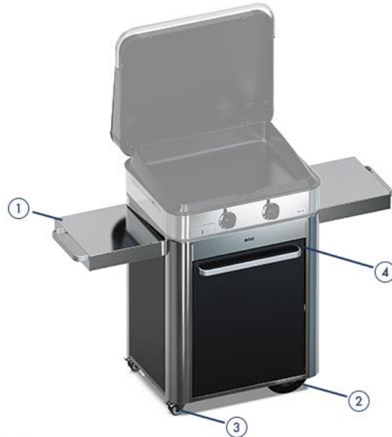
Trolley 1 - Sliding shelves 2 - 2 all-terrain wheels 3 - 2 swivel wheels with brakes 4 - 1 door - aluminium handle